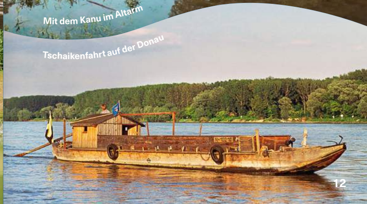
Tschaikenfahrt auf der Donau