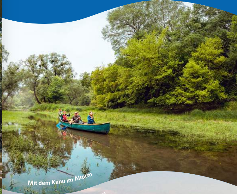
Mit dem Kanu im Altarm

Genaue Informationen zu den Programmen inkl. Zielgruppe, Altersbeschränkungen etc. finden Sie immer aktuell auf www.donauauen.at .