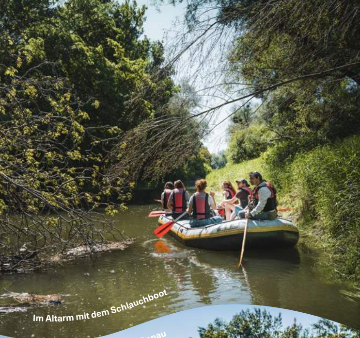
Im Altarm mit dem Schlauchboot