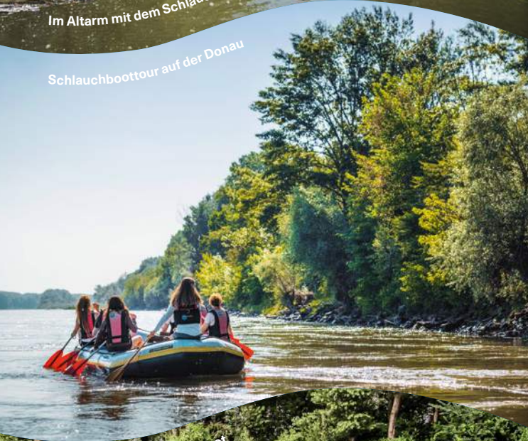
Schlauchboottour auf der Donau