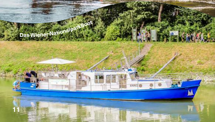
Das Wiener NationalparkBoot